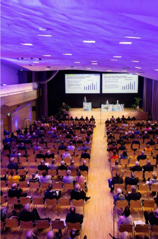
Outokumpu Oyj:n varsinainen yhtiökokous pidettiin maaliskuussa 2023 Dipolin kongressikeskuksessa Espoossa.

Outokumpu-konsernin emoyhtiö Outokumpu Oyj on Suomessa rekisteröity ja kotipaikkaansa pitävä julkinen osakeyhtiö, jonka osake on listattu Nasdaq Helsinki Oy:ssä. Yhtiön pääkonttori sijaitsee Helsingissä. Outokumpu Oyj:n hallintoon ja johtamiseen sovelletaan suomalaisia osakeyhtiöitä koskevia lakeja ja sääntöjä, yhtiön yhtiöjärjestystä sekä yhtiön hallituksen vahvistamaa hallinto- ja ohjauspolitiikkaa.